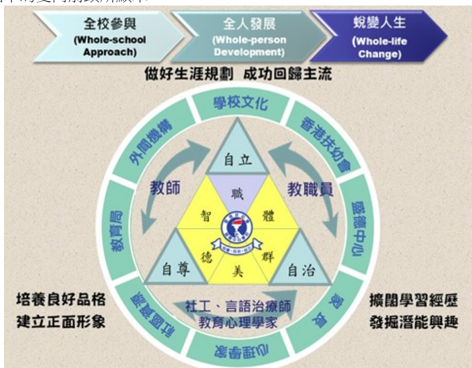
跨專業全校參與教育願景圖

我們十分重視學生的成長，建基於學校班級經營的文化，推動學校跨專業團隊的全校參與(Whole-school approach)，以培育學生的全人發展(Whole-person development)，期望學生在入讀盛德後，能從困難的成長環境中尋找目標，擺脫厄困，成就蛻變人生(Whole-life change)。因此，學校除了重視培育學生的「德、智、體、群、美」五育外，還加入了「職」(職涯發展)的元素，以全面照顧學生的成長需要，達至全人發展。我們相信每個學生都是獨特的，無論他們身處如何不利的成長環境，在師長的輔導及成長支援下，都能從根本改變。我們的使命，是以學生為本，培養良好品格，建立正面形象；擴闊學習經歷，發掘潛能興趣；做好生涯規劃，成功回歸主流(見下圖)。以上的三個目標並非一個線性的發展，因為學生在不斷學習的成長過程中發現自我，會尋找更高更遠的目標，而這正體現出一個螺旋循環的過程，正如下圖中的雙向箭頭所顯示。