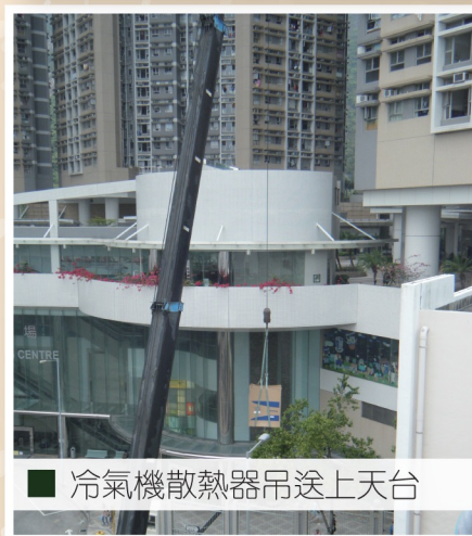
■ 冷氣機散熱器吊送上天台