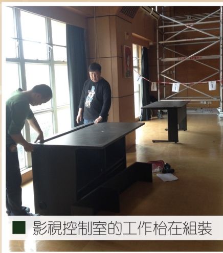
■ 影視控制室的工作枱在組裝