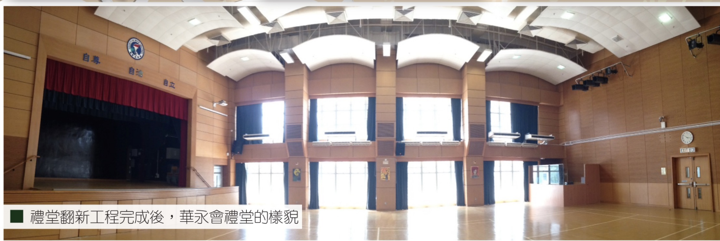
■ 禮堂翻新工程完成後，華永會禮堂的樣貌