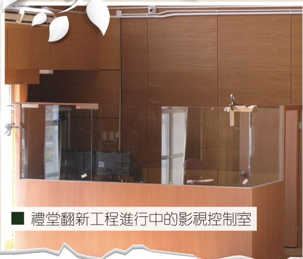
■ 禮堂翻新工程進行中的影視控制室