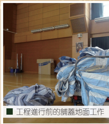
■ 工程進行前的鋪蓋地面工作