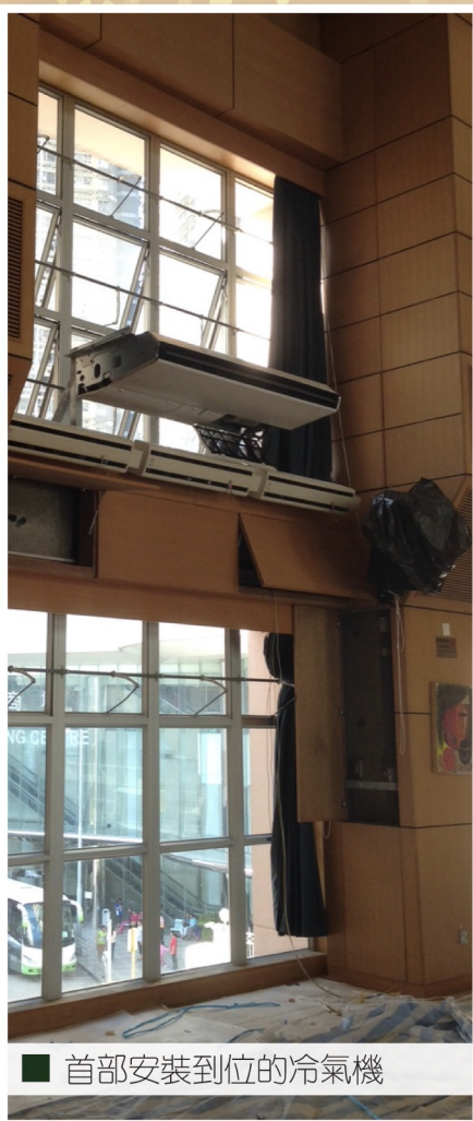
■ 首部安裝到位的冷氣機